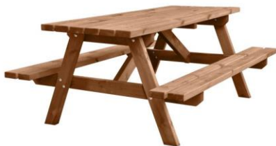
Banco de picnic