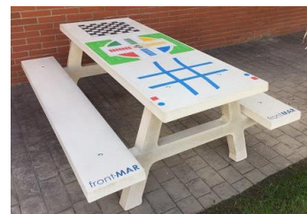
Mesa de picnic con juegos