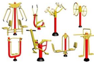
Aparatos de ejercicio para el patio