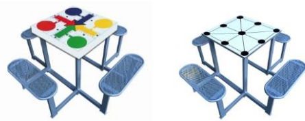
Mesas de exterior con juegos