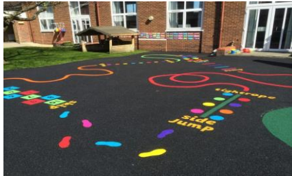
Suelo de goma

Tras analizar las diferentes propuestas, han seleccionado las siguientes: