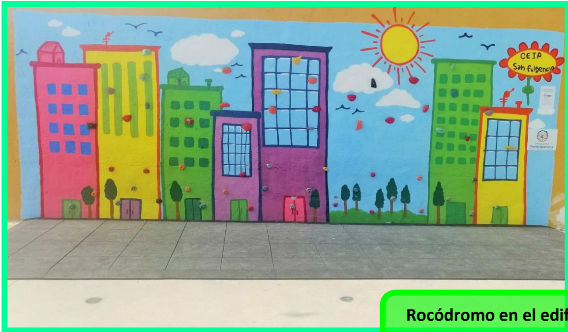
Rocódromo en el edificio de Primaria

Y aquí están los resultados, fruto de un GRAN TRABAJO EN EQUIPO, mucha ilusión y esfuerzo.