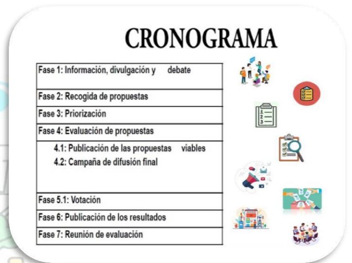
Diapositiva 2. Cronograma