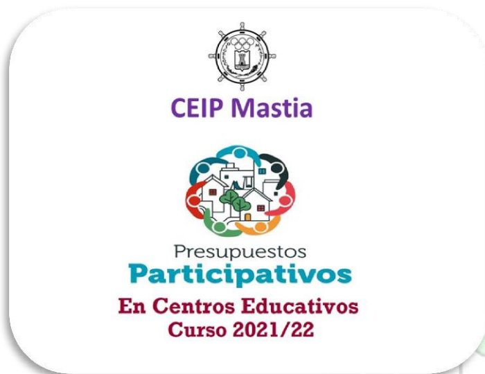
Diapositiva 1. Logos y nombre

Presentación elaborada por algunos alumnos del grupo motor (5º de Primaria) para explicar el proyecto a todos los compañeros del centro