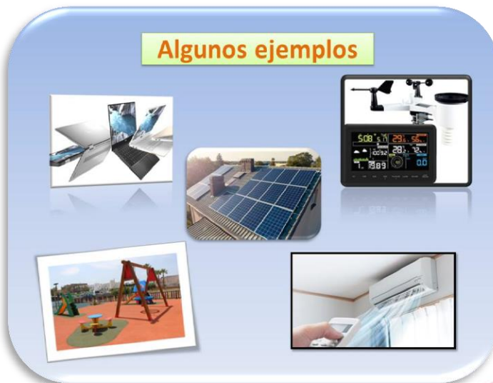
Diapositiva 3. Algunos ejemplos