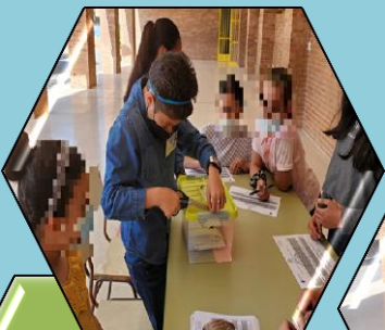
Desprecintando la urna de Infantil