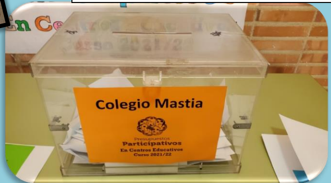
URNA MESA B