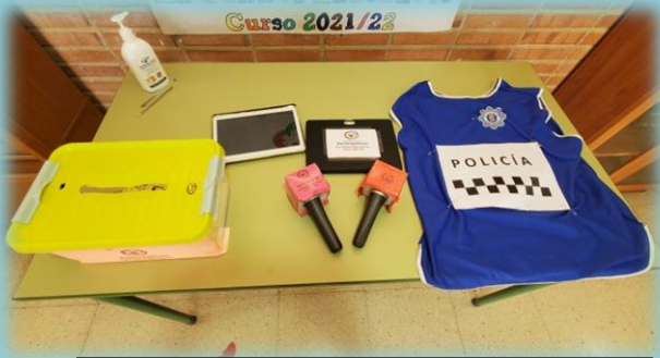
TODO LO NECESARIO