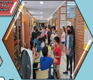
Los más pequeños ejerciendo su derecho al voto