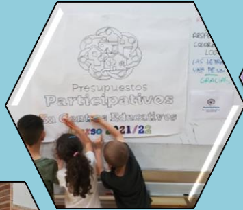
Preparando el cartel