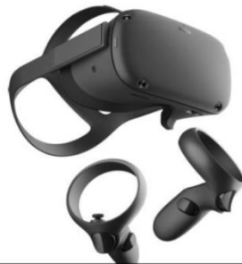
Gafas de Realidad Virtual (entre 2 y 6 unidades)