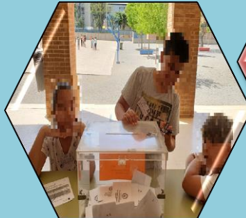
Urnas de Primaria