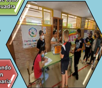
Votando en Primaria