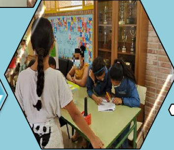
Comprobando el censo