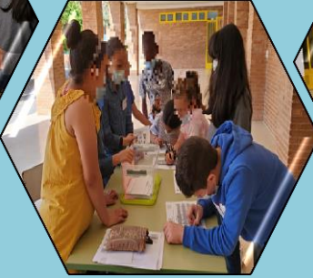
Haciendo el recuento de Infantil