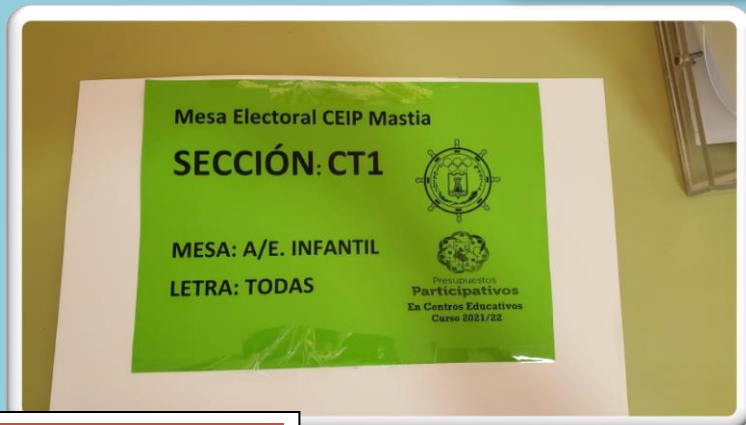
CARTEL INFORMATIVO MESA A