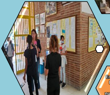
Entrevista a la llegada por parte de nuestro equipo de prensa