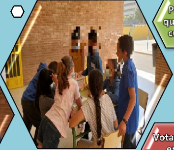
Parece que todo cuadra