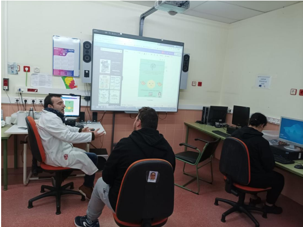
El cartel de anuncio de comienzo del Proyecto, queda finalmente así: