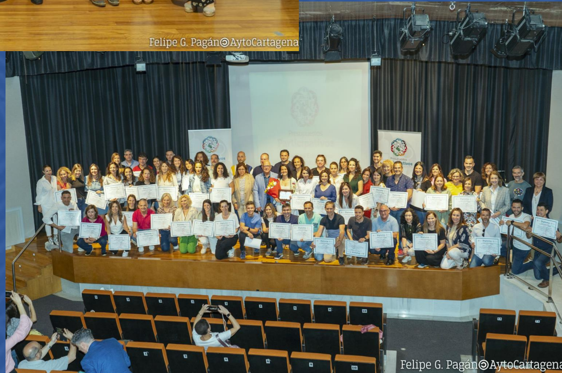
Felipe G. Pagán © AytoCartagena