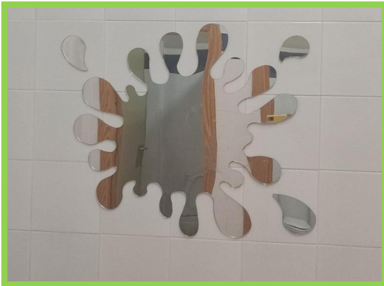
Espejos Aseos Alumnos

Y aquí están los resultados, fruto de un GRAN TRABAJO EN EQUIPO, mucha ilusión y esfuerzo.