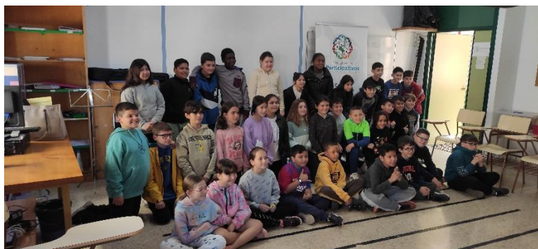
Visita de los responsables del programa durante la fase de recogida de propuestas.

Recogimos las hojas con las propuestas de todas las clases aunque en algunos grupos nos tocó volver varias veces porque no estaban listas. Firmamos los formularios que estaban duplicados y le dejamos una copia a la clase, llevándonos nosotros la otra.