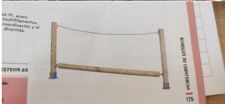
Alumnos consultando catálogos en formato digital.