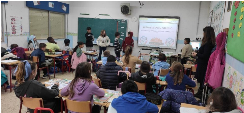
Alumnos del grupo motor durante la primera fase de difusión.

Una mañana todos los alumnos de quinto fuimos por las clases, algunos haciendo el teatro y otros la exposición y dejando la tarea de escribir las propuestas.