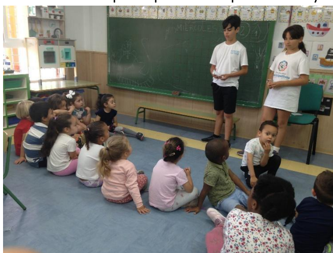
Alumnos del grupo motor comunicando las propuestas descartadas