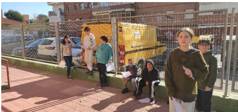
Alumnos del grupo motor ensayando una de las adaptaciones a Teatro informativo.