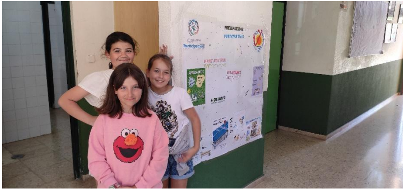
Alumnas del grupo motor colocando un cartel informativo

Incluso después de la primera reunión todavía hubo alguna propuesta más que se tuvo que descartar por varios motivos. Está todo en el acta de la reunión. Fuimos por las clases. Cada uno al grupo en el que había hecho la presentación para explicar las que se iban a votar y los motivos de lo que se había descartado. Aprovechamos también para colgar unos murales explicando las opciones finales y la fecha de la votación.