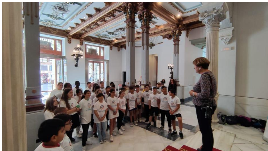
Grupo motor en la visita al palacio consistorial

La visita ha sido muy positiva porque, además de conocer a la vice alcaldesa y participar de una charla con ella, les ha permitido conocer tan emblemático edificio, qué se hace en él, qué estancias lo forman... un edificio que lo han visto todos los alumnos, que han pasado junto a él pero que en su inmensa mayoría no lo conocían. También ha sido positiva porque permite un acercamiento tanto a Cartagena, su ciudad, como a sus instituciones, algo imprescindible si queremos hacer de nuestros alumnos personas implicadas, responsables y conocedoras de qué implica la toma de decisiones siempre pensando en su futuro.