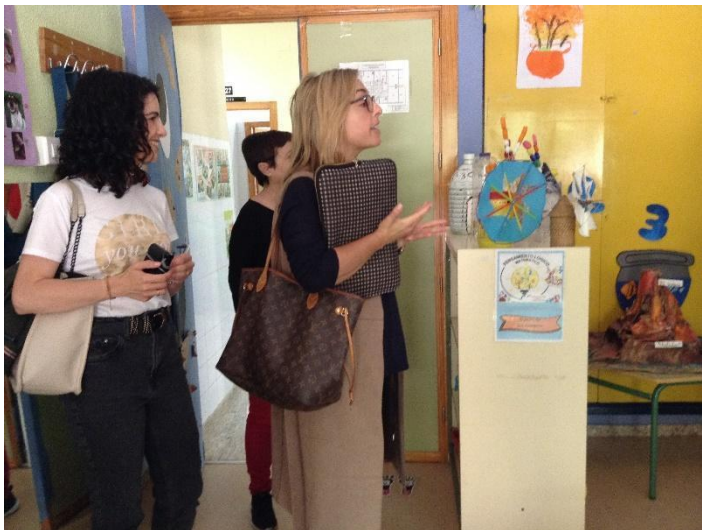
Responsable del ayuntamiento en una de las aulas durante el proceso de votación.