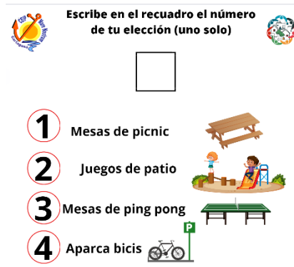
Modelo de papeleta para Primaria.