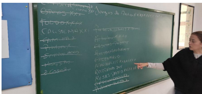
Directora del centro en pleno proceso de priorización y descarte.

Había muchas propuestas que se repetían, nos juntamos en la sala de profesores y fuimos ordenándolas, contando cuantas veces se repetía cada una. De ahí nos quedamos con las más nombradas y hablamos con la directora para ver que había que descartar.