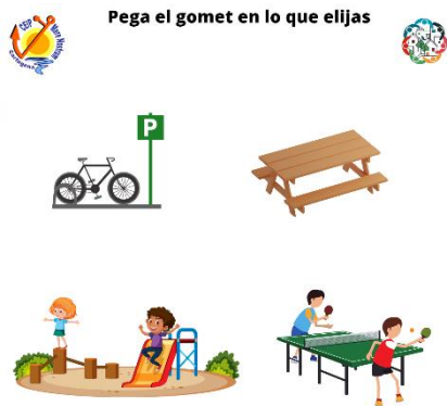
Modelo de papeleta para Infantil