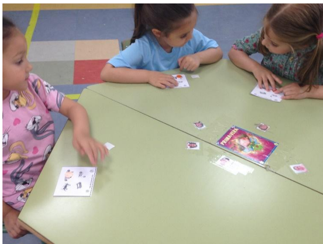
Alumnos de infantil en el momento de la votación.

Salieron por orden de votación las opciones: Juegos de patio, Mesas de picnic, Mesas de ping pong y aparcabicis.