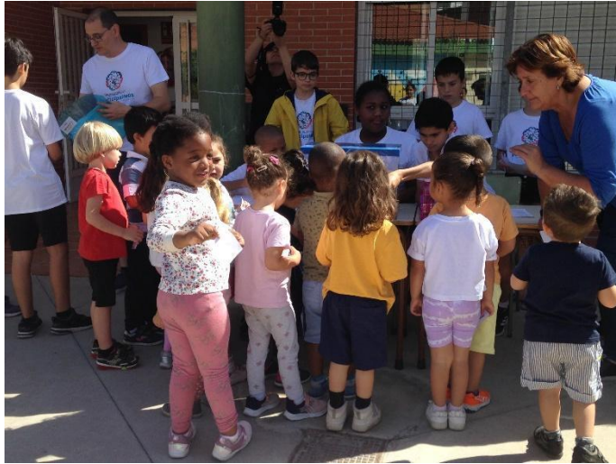
Alumnos haciendo cola para introducir su voto en una de las urnas.