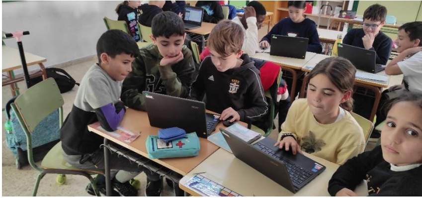
Alumnos del grupo motor en una de las sesiones de elaboración de material / lluvia de ideas.