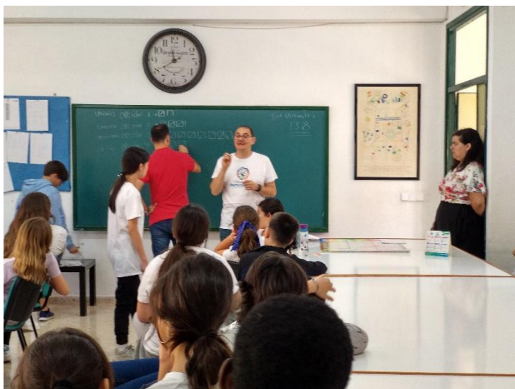
Recuento en la sala de profesores.