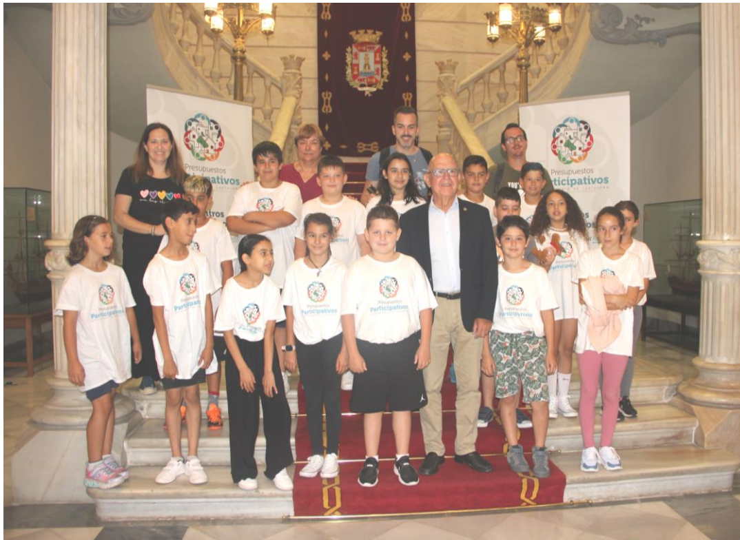
Cierre de Presupuestos Participativos en Centros Educativos (Junio 2023)

30001916@murciaeduca.es 968-546009 / @ceipsanginés