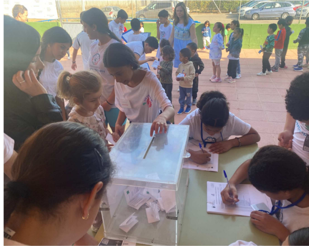
Alumnos de Educación Infantil recibiendo las indicaciones para votar

Código Centro: 30002350 APT. DE CORREOS, Nº 4 (B.PERAL) 30300 ASOMADA (LA) Teléfono: 968502103 Fax: 968502103 Email: 30002350@murciaeduca.es