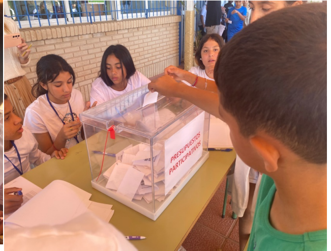
Votación de los distintos niveles y etapas