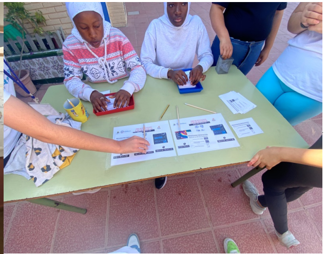
Mesas informativas durante las votaciones