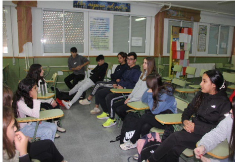
Representantes del grupo motor 4ºA