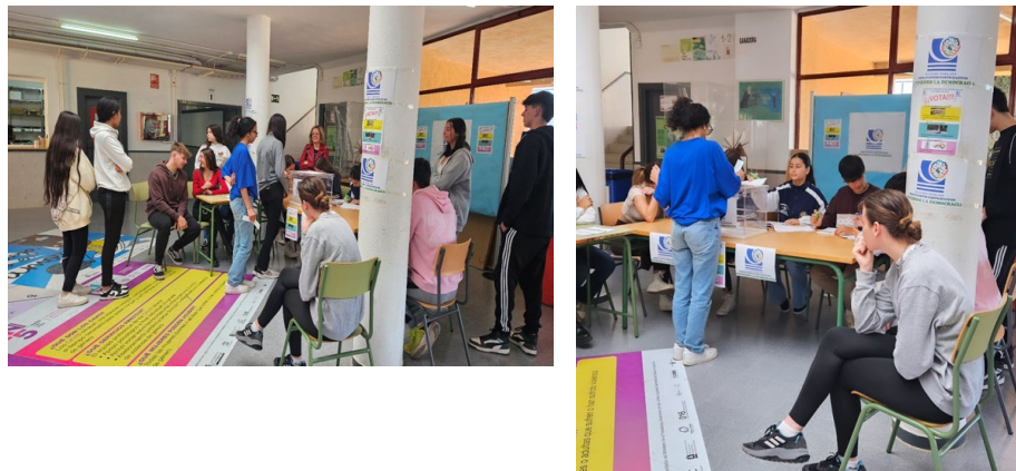
Alumnos del centro durante el proceso de votación